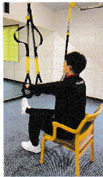
膝関節運動(大腿四頭 筋のトレーニング)