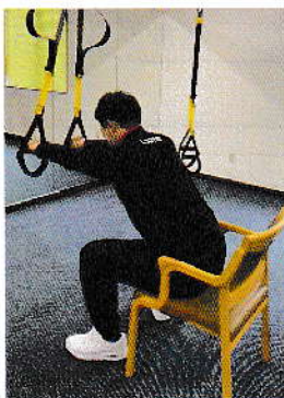
立ち上がる為の 前屈動作