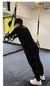
動的バランス訓練(体 幹のトレーニング)